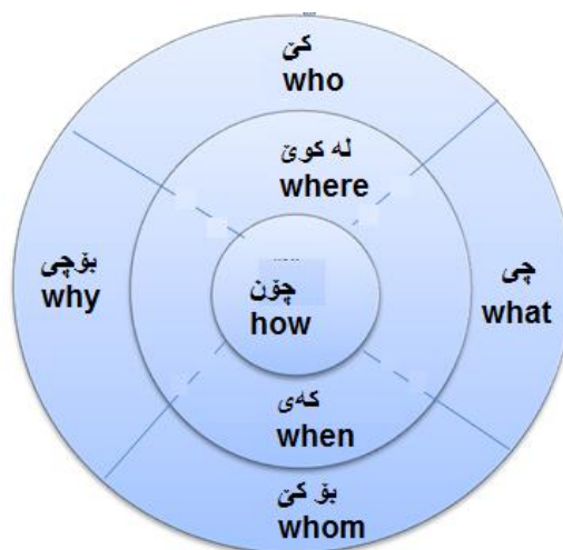
هیلکاری پیکهاته‌ی بانگه‌شه‌کردن

ئهم بازنه‌یه ره‌گه‌زه‌کانی بانگه‌شه‌ی هه‌لبژاردن له خۆده‌گریت، هه‌ر ره‌گه‌زیک له‌م ره‌گه‌زانه له هه‌لبژاردنه‌دا رۆلی خۆی هه‌یه له به‌جیه‌ینانی ئهم پرۆسه‌یه، چونکه لایه‌نیکی ته‌واوکه‌ره بۆ ئهم پرۆسه‌یه، پراکتیزه‌کردنی ئهم بازنه‌یه له‌سه‌ر بانگه‌شه‌ی هه‌لبژاردن لای پالیئوراون ئهمه زیاتر رونده‌کاته‌وه .