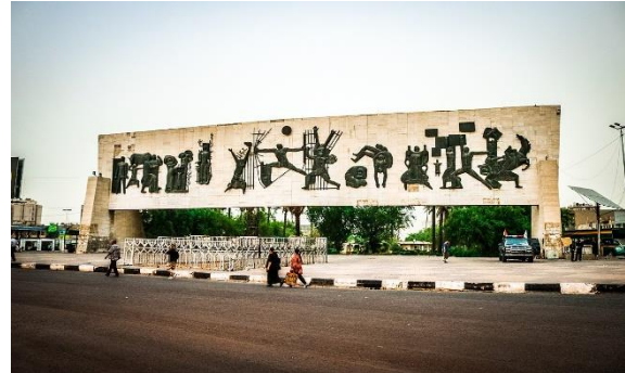
وینهی (۳) گۆره پانی تهحریر له بهغداد