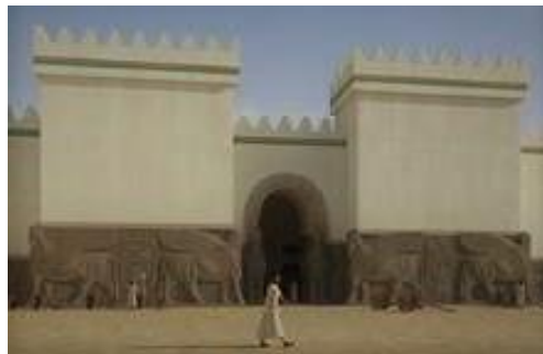
وینه ی (۲): گۆرهپانی ناو شاری ئاشور له ( ۹۱۱ – ۶۱۲ ) پیش زاین.

سه رده می نوئ ره هه ندیکی دیکه ی به گۆرهپان به خشی ئەویش ره هه ندی به جیهانیبون بو، گۆرهپان ئەو قوناغه ی تییه راند که له نیو جوارچیوه ی یاسا سه پینراوهکانی شارستانیته که کاتدا دابمه زریت و له روی به کاربردنه وه تایبه ت بیت به و شارستانیته، به لکو گۆرهپان له سه رده می نویدا بوه شوینگه یهک و فه زایه کی گشتی که تییدا وهک ناوه ندیکی فره ههنگی و شوینگه یهک بۆ به سه ربردنی شارنشینان، هه ر بۆیه ده شیت ئەوه بلتین که گۆرهپان له سه رده می دیریندا هه لگری ماهیه تی سه پینراوی خواستی ده سه لاتداران بووه، به لام سه رده می نوئ ماهیه تی گۆرهپانی گۆری له خواستیکی