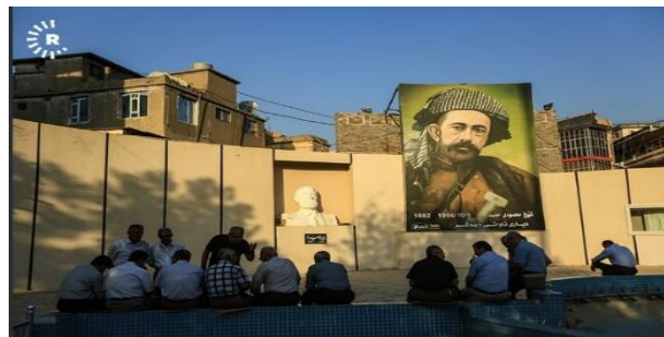
وینهی (۴): گۆره پانی بهردهرکی سههرا له سلیمانی

دا دیاره. بۆیه له رهههندهکانی ئەم کاریگهريه وه گۆره پان گرنگی پیدراوه "فهزای گشتی - گۆره پان وهک بهشیکی گرنگ له پیکاتهی شار بهشدار ده بیته، ئەم فهزایه شونیکه که زۆرتین بهریه ککه وتن و بینین له نیوان تاکهکانی ئەو پانتایه و فۆرمهکانی ناو ئەو پانتایه پوده دات، هه ربۆیه له م سالانهی دوایدا بنیادنان و نهخشه سازی شار بهرامبهر به بهریه ککه وتنه کومه لایه تیه کان به شیوهیه کی ههستیار دارپژراوه، چونکه کاریگهری باش و ناباش له سهه کومه لگه به جیده هیلت " (مهديه فرح بخش، لا ۲). له م تیروانینه وه ده کریت په یوه هندیه کی نیوان گۆره پانیک و تاکیکی کومه لگه به په یوه هندیه کی گرنگ و دوانه و دوینراو ته مه شا بکریت، ئەمهش له بهر ئەوهی بهریه ککه وتنه که به شیوهیه کی راسته وخۆیه و کاریگه ریه کی راسته وخۆ دهگه نه بینه ره که. وهک وینهی (۴).