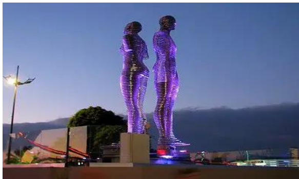
وینه ی (۵): په یکه ری ( پیاو و زن ) ولاتی جۆرجیا

له بهریکه و تنیکی راسته و خودا و له فهزایه کی چوار ره هه نددا. بونی په یکه ریک له فهزای گشتی گۆره پانیکدا ده بیته یه که یه که له پیکهاته ی یه که ی گشتی شار، بویه ده شیت په یکه ریکی جیگیرکراو له و گۆره پانه بیته یه که یه کی ئیستاتیکی له یه که گشتیه که ی شار، به م پینه په یه که ریک له رۆلی به رجه سته کردنی جوانیدا ده بیت له گه ل ئه رکی دیکه ی وه ک فرههنگی و کومه لایه تی " (حمید رضا شیبات، سغد احمد فروزنده، لا ۲). له م دیده وه ده شیت فهزای گشتی گۆره پان وه ک پانتاییه کی گرنگ و فاکته ریکی ئه رینی ده سنیشان بکریت که ره هه نده کانی جوانی و فرههنگی و کومه لایه تی تیدا جیگیر ده کریت، که به هوی