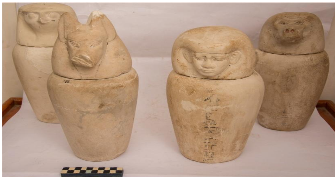
وینهی کوبه له کانی کانوبی (الوانی الکانوبیة)، وەرگیراوه له (سلام، ۲۰۱۸، ۱۰۹)