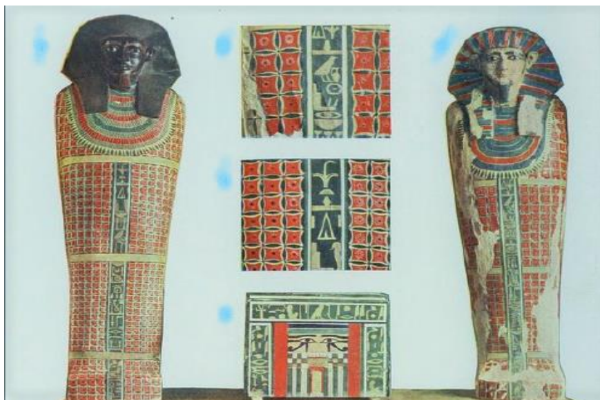
وینه‌ی دو تابوتی سه‌رده‌می ئیمپراتۆری، وه‌رگیراوه له‌ (Murray, 1910, 10)

دوای ئەو هی کاری مۆمیاکردن ته‌واوبوه لاشه مۆمیاکراوه‌که‌یان خستۆته ناو تابوت، شیوه و قه‌باری تابوت به‌پێی سه‌رده‌م گۆرانکاری به‌سه‌ردا هاتوه و گه‌شه‌ی کردوه، سه‌رده‌می ئیمپراتۆری تابوته‌کان له‌ دار یان به‌رد له‌شیوه‌ی جه‌سته‌ی مردوه‌که‌ دروستکراون، وینه‌ی ده‌موچاوی که‌سه‌که‌ له‌سه‌ر تابوته‌که‌ هه‌لکۆل‌دراوه، له‌روی ده‌ره‌وه‌ی چه‌ندین وینه و هیما و ئاماژه‌ی ئایینی نه‌خشینه‌دراوه، وه‌ک ئەم نمونه‌یه‌ی خواره‌وه: