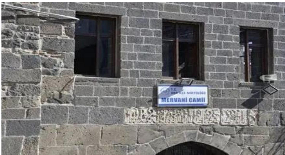
پاشکۆی (۳) وینهی مزگهوتی مهروانی