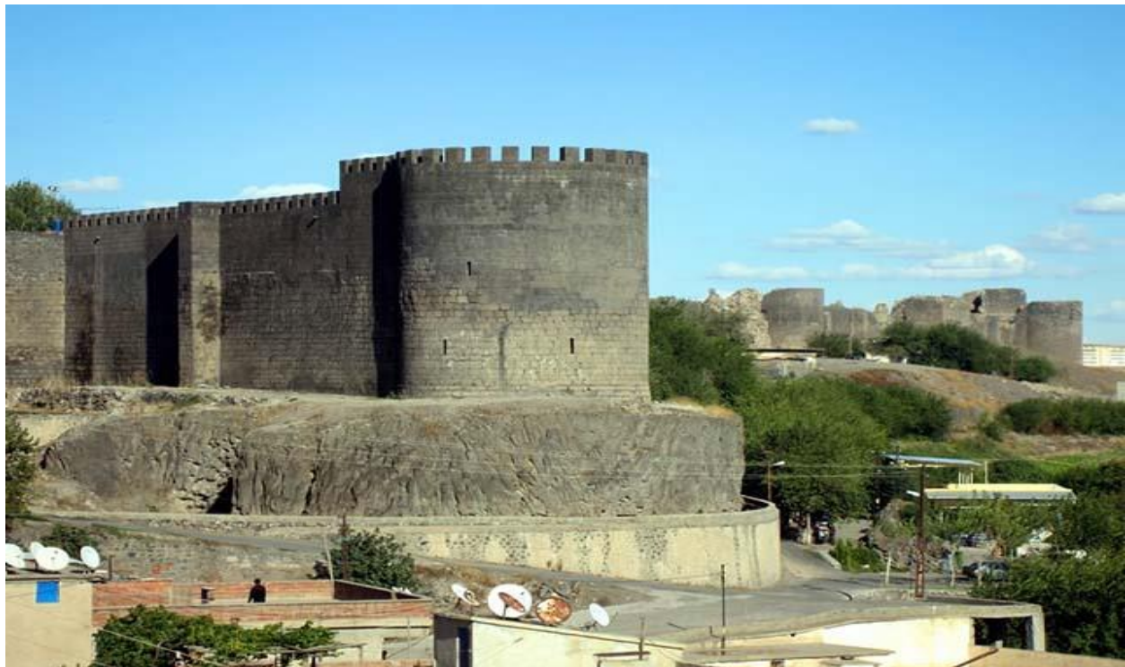
پاشکۆی (١) وێنەى قەلای نامەد

7. الجریب = ٣٦٠٠ زراع و = ٢م١٥٩٢ ( الخوارزمي، ب.س، ٩٢؛ الدوري، عبدالعزيز، ١٩٩٥، ٢١٦). لەمڕۆدا نیودۆنم زەوی زیاتر دەکات، چونکە یەک دۆنم = ٢م٢٥٠٠.