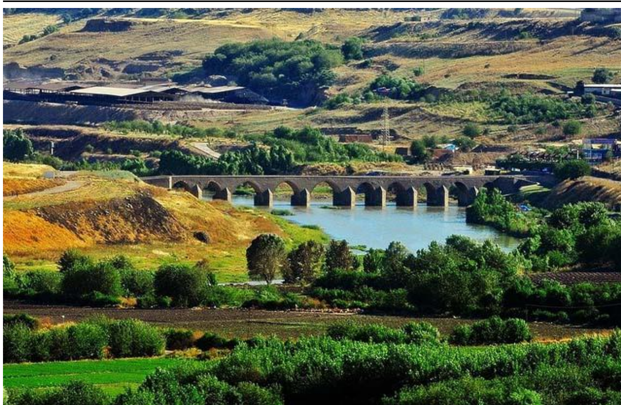
پاشکۆی (۲) وینهی پردی دهچاو