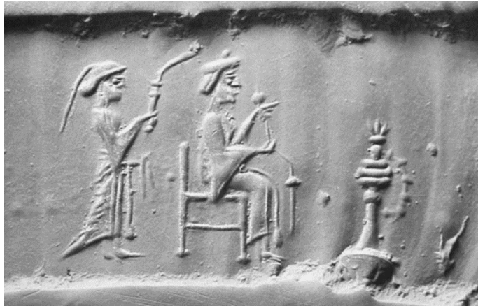
وینه ی ژماره (5) مۆریکی لوله ی سه رده می ده وله تی هه خامه نشی که وینه ی ژنانی له سه ر هه لکه ندراره (صفایی، 1394، 122)

پینگه کۆمه لایه تییه بالایانهی هه یانبوه زۆر گه وره تر نیشاندراون به به راود به و خزمه تکارانهی وینه یان له گه ل شازن کیشراوه که ئه مه ش تایبه تمه ندیه کی هونه ری هه خامه نشی بوه (ملک زاده، 1347، 103). روبه روی ده یان نمونه ی ئه م نمایشه و به بچوکنیشاندانی خزمه تکاران له چه ندین شوینی جیاواز له سه ر دیواره کانی ته ختی جه مشید ده بنه وه، که له پشتی هه ر پاشایه ک ده بیئری، به هه مانشیوه به گشتی و له چه ند وینه یه ک که ژنانی هه خامه نشی تیدا نیشاندراوه هاوه لیک به بچوکراره ی له پشت یاخود پیش شازنانی هه خامه نشیش ده بیئری. لیرنه ر پیویه ئه م ژنه ی له سه ر ئه م مؤره نه خشیئراوه نا کرئ ته نها وا بناسری یه کیک له شازنانی ناو کۆشکی هه خامه نشیه، به لکو ده کریت ژنیکی خانه دانی دهره وه ی کۆشک و له خیزانه خانه دانه کانی تری هه ریمه کانی سه ر به قه له مره ی ده وله تی هه خامه نشی بیت (2010,154).