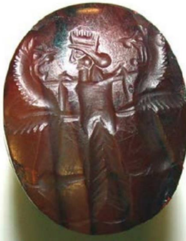
چونەژورەوہى کۆشكى پاشا دروستکراو لە (مترۆپۆلتن) لە نیۆرك ھەنگراوہ میژوہکەى

لەسەردەمی ھەخامەنشی سەرھەرای سود وەرگرتن لە گل و گەچ بۆ دروستکردنی مۆرد، بەردی بەنرخ و کانزای بەنرخى وەك زێرشیان بەکار دەھێنا، ئەو بەردانەى بۆ ئەم مەبەستە بەکار دەھێنران بریتیون لە بەردى رەق و گرانیت و نەیزەك (بروانە وینەى ژمارە 1)، سەرھەرای بەنرخیان ئەم بەردانە بەلایانەووە پیرۆزیش بون و شیوازی مۆرەکانیش تەواو ئەندازە بون شیوہى چوارگۆشە و خڕ و ھێلکەى بون قەبارەى ئەم مۆرانە لە 1-10 سم بون و قولى ھەلکۆلینی سەرمۆرەكان دو ملیم دەبیت بە تیکرای، ھەلکۆلینی ھونەرى سەر مۆرەكان بەبەرورد بە ھەلکۆلکارییە بەردینە گەورەکانی قەدپالی چیاکان و دیوارەکانی تەختی جەمشید و گۆرە پاشاییەکان دەتوانن بە بچوکترین ھەلکۆلکاری دابنریت، بەلام لەراستیدا ئەم ھەلکۆلکارییە ھونەرییە وردانەش وەك ھەلکۆلکارییە قەبە و گەورەكان نیشانە و ئاماژەبون بۆ ھیز و شکۆمەندى شاھانەى، (ویل دورانت، 2011، 614)؛ (شمس الدین، 1393، 106).